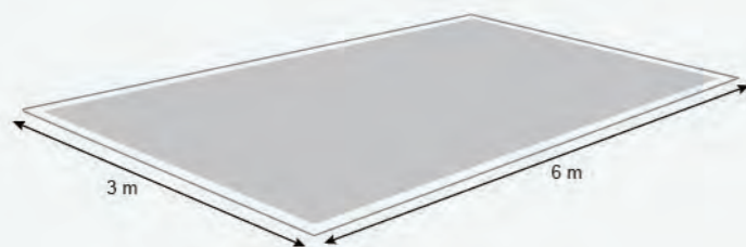
Exemple de stand nu de 18m 2